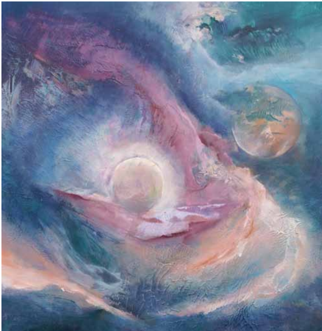
Oerknal, Acryl op board, 80x 80 cm, Aad Orgelist

Maatschappij en bewustwording zijn onlosmakelijk met elkaar verbonden. Sommige spiritisten willen liever niet weten wat er op deze aarde gebeurt en geven aan dat alles liefde is. Dat is natuurlijk ook zo, maar we moeten ons realiseren dat we op een aarde wonen waar het er net even anders aan toe gaat. Wanneer je het kwaad niet wil zien of ontkent en je je heil zoekt in het licht dan kan het kwaad ongemerkt zijn gang gaan. Met een verhoogd bewustzijn open je je hart, maar word je ook bewust van de misstanden in onze maatschappij. Door ook onze aandacht te vestigen op het kwaad dat onze aarde plundert, kan die niet meer ongemerkt zijn gang gaan.